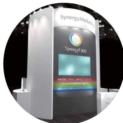
シナジーマーケティング ブース No.120

TEL：03-5261-7511 E-mail：sales@synergy101.jp