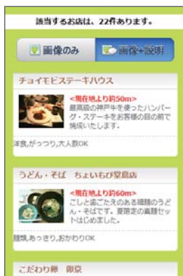
お店を選択します