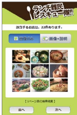
写真で検索も可能です